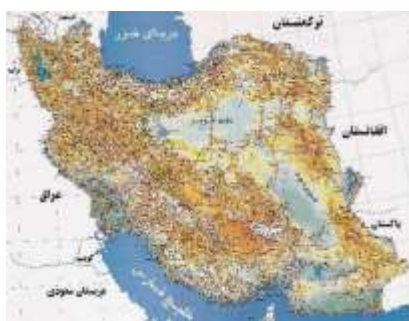
نقشه ۱-۲ نقشه ایران

باید تا حد امکان از به‌کاربردن صفحه‌های بزرگ مانند نقشه‌ها در پایان‌نامه خودداری شود و آنها را از طریق رونوشت‌های (فتوکپی‌های) مخصوص در اندازه تعیین شده تهیه کرد. در صورت لزوم باید به دقت صفحه مورد نظر را داخل پایان‌نامه طوری تا نمود که لبه آن از دیگر صفحه‌ها بیرون نزنند.