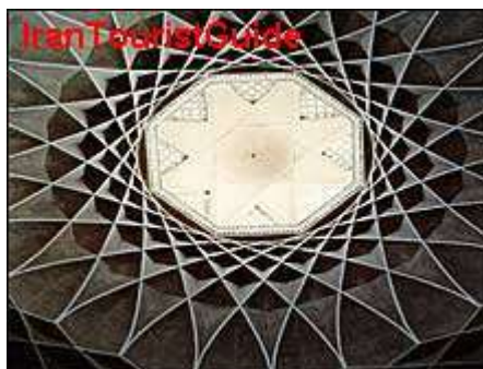
شکل ۱-۲ یک اثر معماری

گاه برای نشان دادن یک دستگاه، شیء یا رویداد، تنها از عکس می‌توان کمک گرفت. هرگاه جزء خاصی از عکس مورد نظر است، باید به گونه‌ای تهیه شود که اجزای فرعی چشمگیرتر از جزء مورد نظر نباشد (شکل ۱-۲).